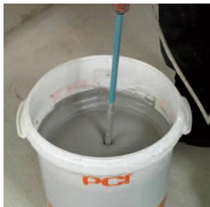
Перемешать оба компонента при помощи низкооборотистой дрели и насадки