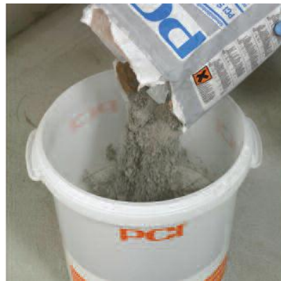
Засыпьте сухой компонент PCI Seccoral 2K Rapid в ёмкость