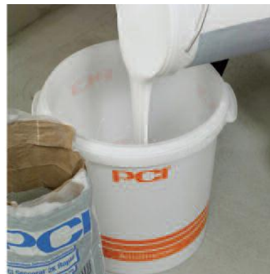
Добавить жидкий компонент PCI Seccoral 2K Rapid