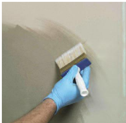
Увлажните основание перед применением гидроизоляции