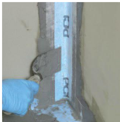
Уложите уплотнительную ленту в местах углов и стыков между слоями гидроизоляции