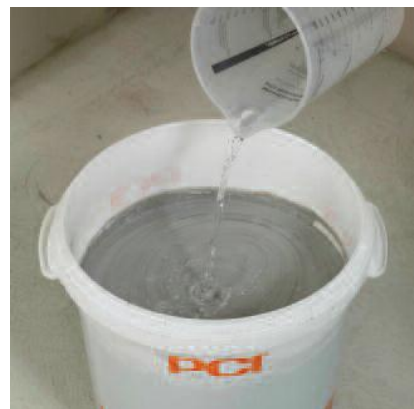
При необходимости добавить воды в готовую смесь