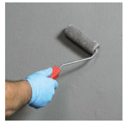
Нанесите на всю площадь первый слой гидроизоляции Seccoral 2K Rapid при помощи валика