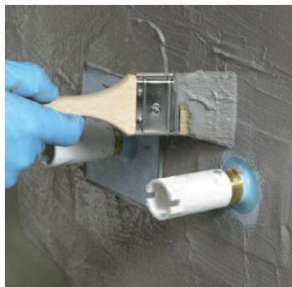
Используйте гидроизоляционную манжету PCI Resitare в местах закладных деталей